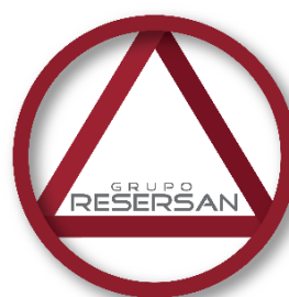
Figura 1. Logotipo de grupo RESERSAN

GRUPO RESERSAN (Figura 1) es una empresa familiar que adopta la figura de una Unidad Estratégica de Negocios (UEN) en la que se comparte un conjunto común de clientes, competidores, tecnologías, etc.